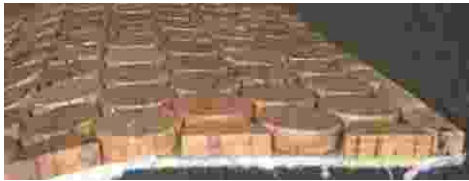
Korkmosaik auf Quarzträger 8mm Stärke.

Mosaik aus Massivkork gibt es in verschiedenen Verlegeeinheiten. Der Standard ist ca. 60 x 30 cm und 6mm Stärke auf Lochpapier.